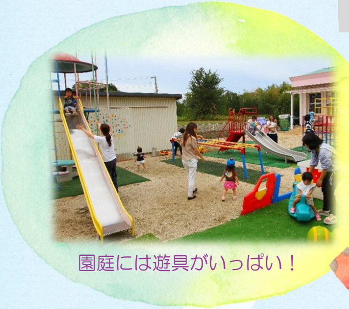
園庭には遊具がいっぱい!