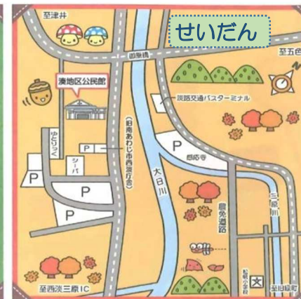
せいだんひろば（湊地区公民館）