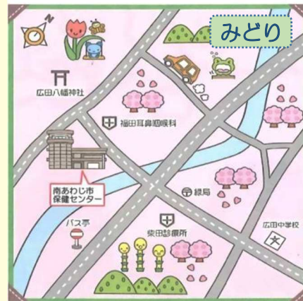
みどりひろば（保健センター）