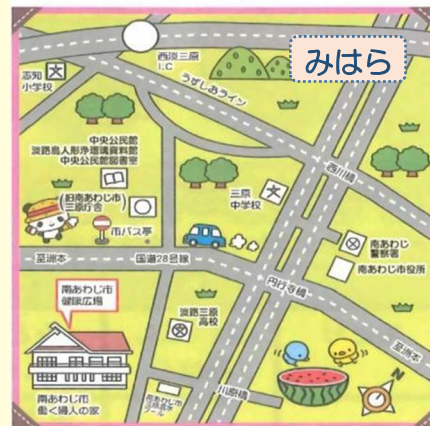
みはらひろば（働く婦人の家）