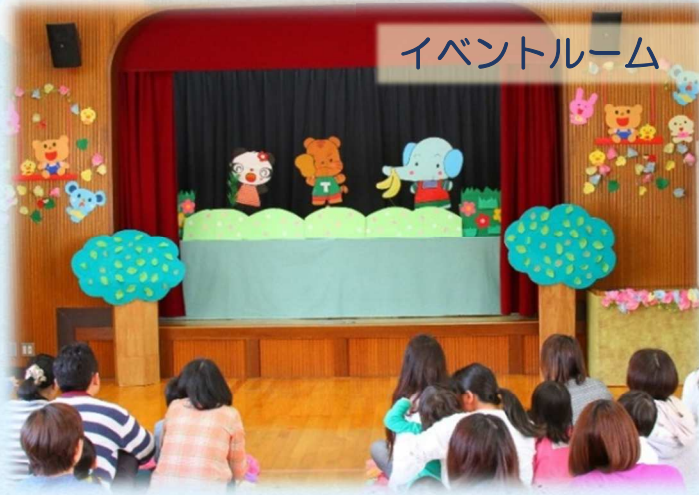
イベントルーム ミントのお部屋