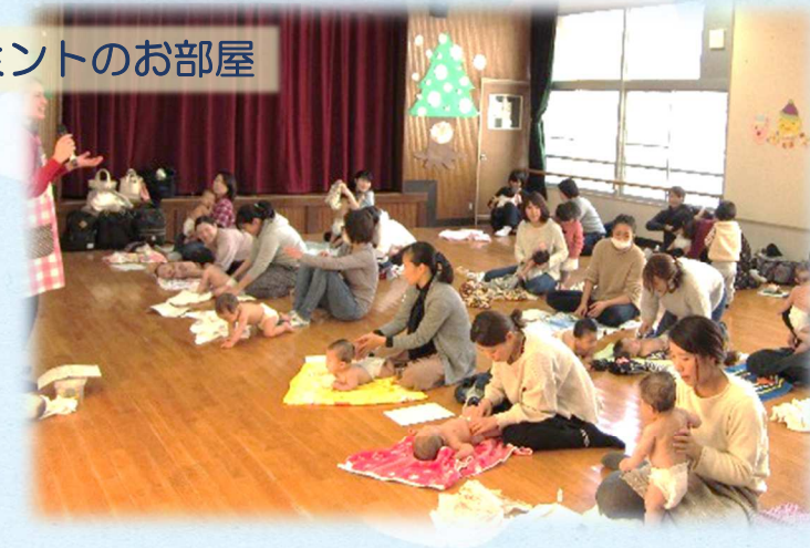
ベビーマッサージ教室