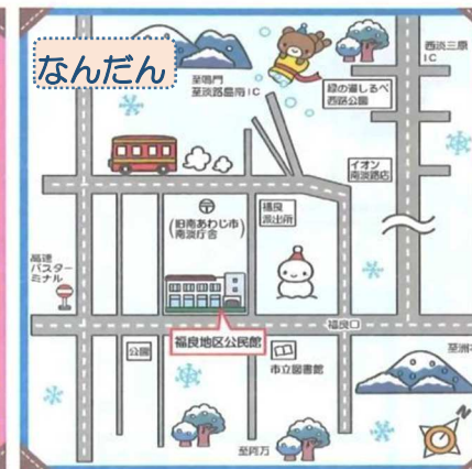
なんだんひろば（福良地区公民館）