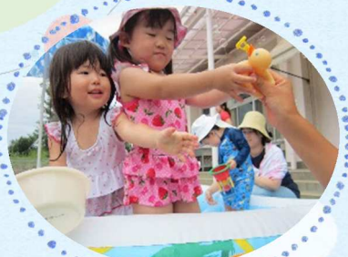
夏は園庭で水遊び!!